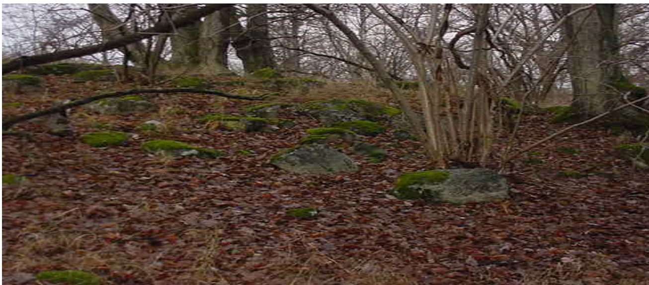
Läget för det förhistoriska Kårnäs. Gravfältet är beläget bakom kullen.