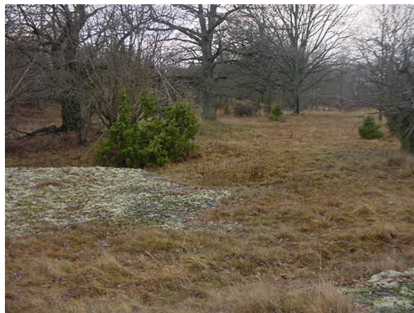
Järnåldersgravfältet i Storängsudd