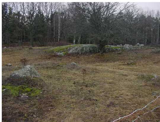
Läget för Lilla Kårnäs under 1500 – 1600-talet

Lilla Kårnäs ägdes av bonden Hindrick och 1539 gav han i skattepenning 1½ mark, 6 dagswerken, 1 lamb, 20 egg och 1 lispund smör.