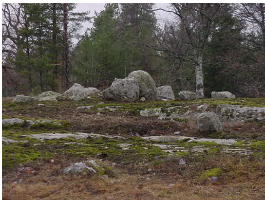
Del av byområdet Lilla Kårnäs

Den del som skiftades och blev Lilla Kårnäs vet vi med relativt stor säkerhet var det var beläget, ungefär 200 m västerut från Storängsudds parkering och på höger sida efter svackan. De gamla aplarna, slånbarssnåren, nyponbuskar och krusbär vittnar om det liv som en gång levts här. Den nuvarande vägen går rakt igenom det som en gång var Lilla Kårnäs by. Där finns ett flertal husrester, många eldstäder och fägata som vittnar om att det under perioder varit stor aktivitet på platsen.