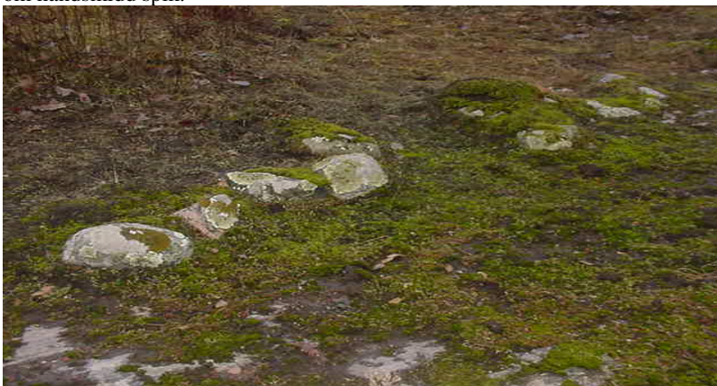
Ingången till parstugan

De lösfynd som har hittats inom byrådet bedöms vara just 16-1700-tal. Grunden från en parstuga finns inom byn, den bedöms vara från sent 1600 – början 1700-talet. De flesta fynden har gjorts i anslutning till grunden, bl.a. en järnxyxa, del av en passare i brons, mynt daterade så sent som 1670-tal, rester av gjutjärnsgrutor och överallt gott om handsmidd spik.